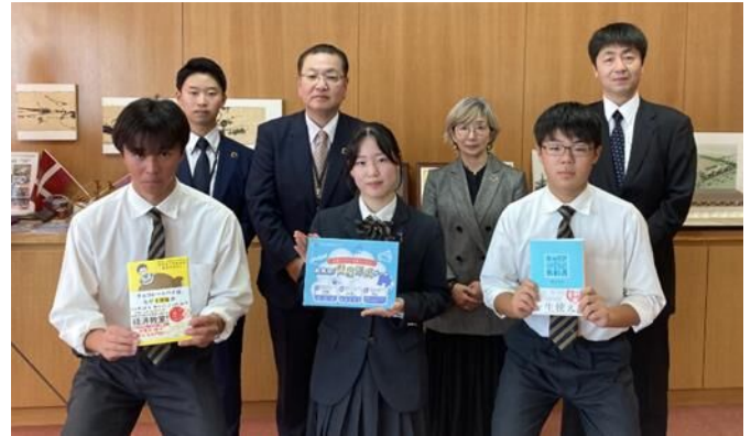
前列 北海道登別明日中等教育学校 代 表 生 徒