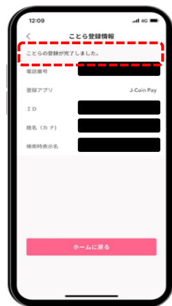
STEP 4 「ことらの登録が完了しました」の表示がされたら、手続完了