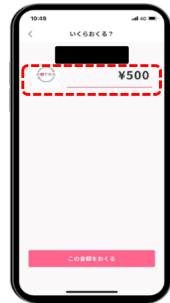
STEP 4 送金先の名前が表示されるので、金額を入力して送金する