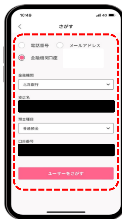
STEP 3 送金先の口座情報を入力し「ユーザーをさがす」を選択