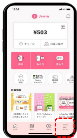
STEP 1 J-Coin Pay ホーム画面の「メニュー」を選択する