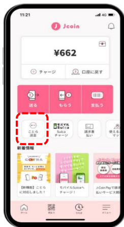
STEP 1 J-Coin Pay ホーム画面の「ことら送金」を選択する