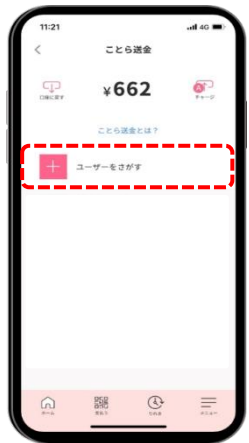
STEP 2 「ユーザーをさがす」を選択する