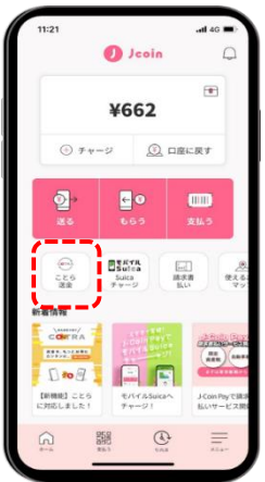
STEP 1 J-Coin Pay ホーム画面の「ことら送金」を選択する