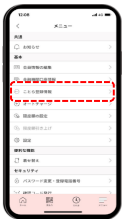
STEP 2 「ことら登録情報」を選択する