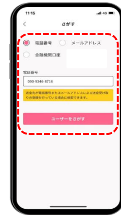
STEP 3 送金先の電話番号等の情報を入力し「ユーザーをさがす」を選択