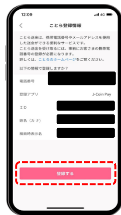
STEP 3 ことら登録情報が表示されるので「登録する」を選択