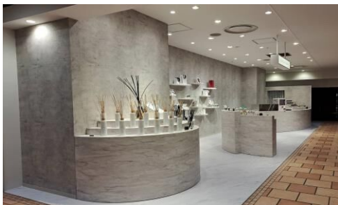
・札幌市商業施設内香水ブランド店