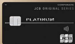
● JCBプラチナ法人カード