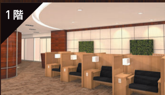
1階 ラウンジスペース [パーソナルブース 8席]