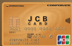
● JCBコーポレートカード

北洋銀行が発行する以下のカードをお持ちの方がご利用いただけます (※Cloverゴールドカードは対象外です)