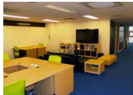
「Garage labs <ガレージラボ>」 ( http://garage-labs.jp/ )

道内では昨年11月に道内初のコワーキング・スペース「Garage labs <ガレージラボ>」が札幌市内にオープン。この他にも新たなスペースの開設の動きがある。