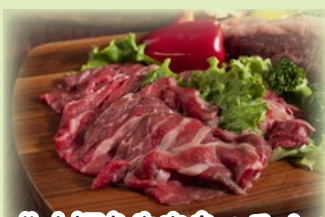
北大短角牛赤身スライス 300g.....1,599円