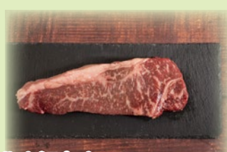
北大短角牛ロースステーキ 300g.....3,089円