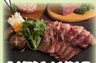
北大短角牛すき焼き用 300g.....2,160円