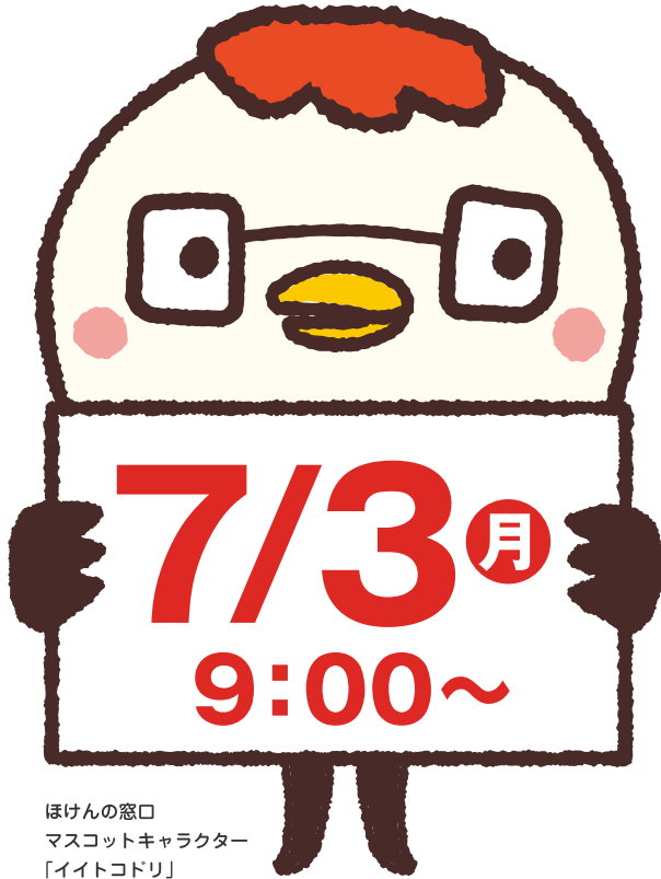
ほけんの窓口 マスコットキャラクター 「イトコドリ」