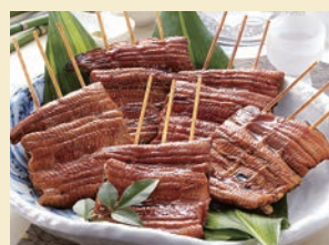
うなぎ割烹「一慎」 特製串蒲焼セット