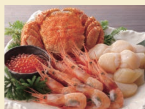
毛ガニ・ほたて・えび・いくら 海鮮セット