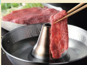
近江牛 しゃぶしゃぶ用肩肉