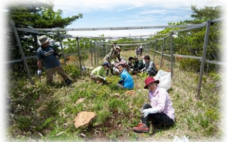
高山植物の再生活動