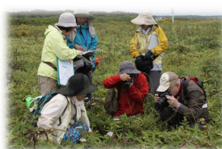
湿原での植物調査