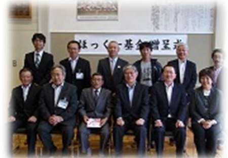
贈呈式(平成26年7月10日)