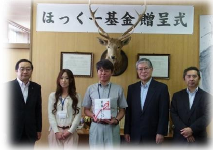
贈呈式(平成26年6月12日)