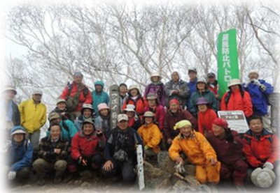
盗掘防止パトロール