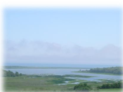
北海道湖水地方の湿原とラグーン