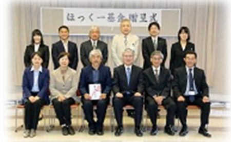
贈呈式(平成26年5月23日)