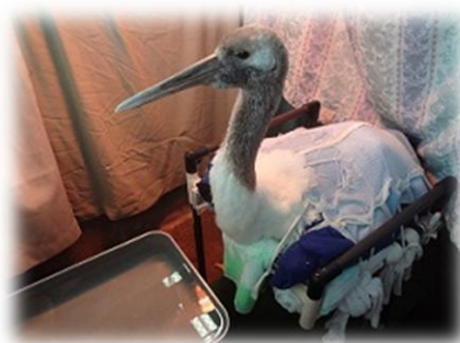
治療中のタンチョウ