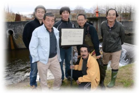
役員・会員の皆さま(修復完了時)