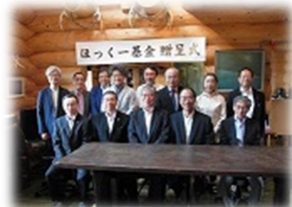
贈呈式(平成26年7月9日)