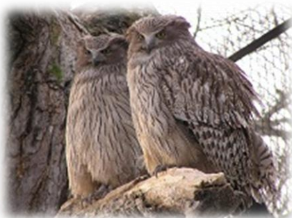
繁殖に成功したシマフクロウ