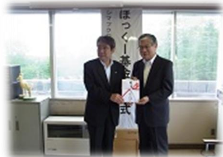
贈呈式(平成26年7月11日)